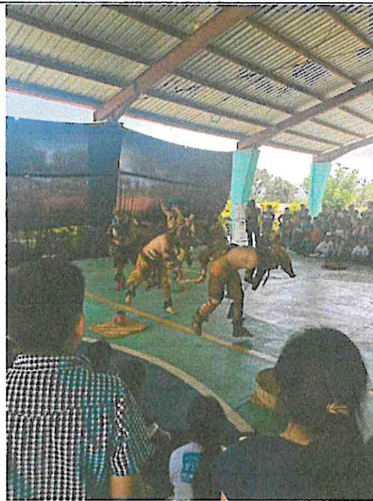
Escena de la presentación de danza: Wojay – Vivencias en el Hogar, Grupo Sotz'il E.O.R.M Comunidad de Chuk Muk, Santiago Atitlan, Sololá, Guatemala. 23/07/2024