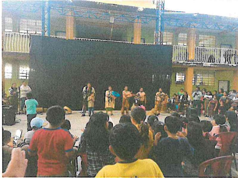
Escena de la presentación de danza: Wójay – Vivencias en el Hogar, Grupo Sotz'íl, E.O.U.M Jornada Matutina San Pablo La Laguna, Sololá 24/07/2024