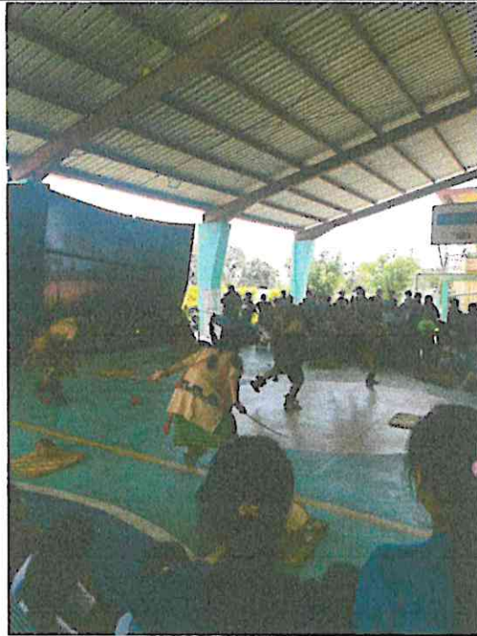
Publico en la presentación de danza: Wojay – Vivencias en el Hogar, Grupo Sotz'il E.O.R.M Comunidad de Chuk Muk Santiago Atitlan, Sololá, Guatemala. 23/07/2024