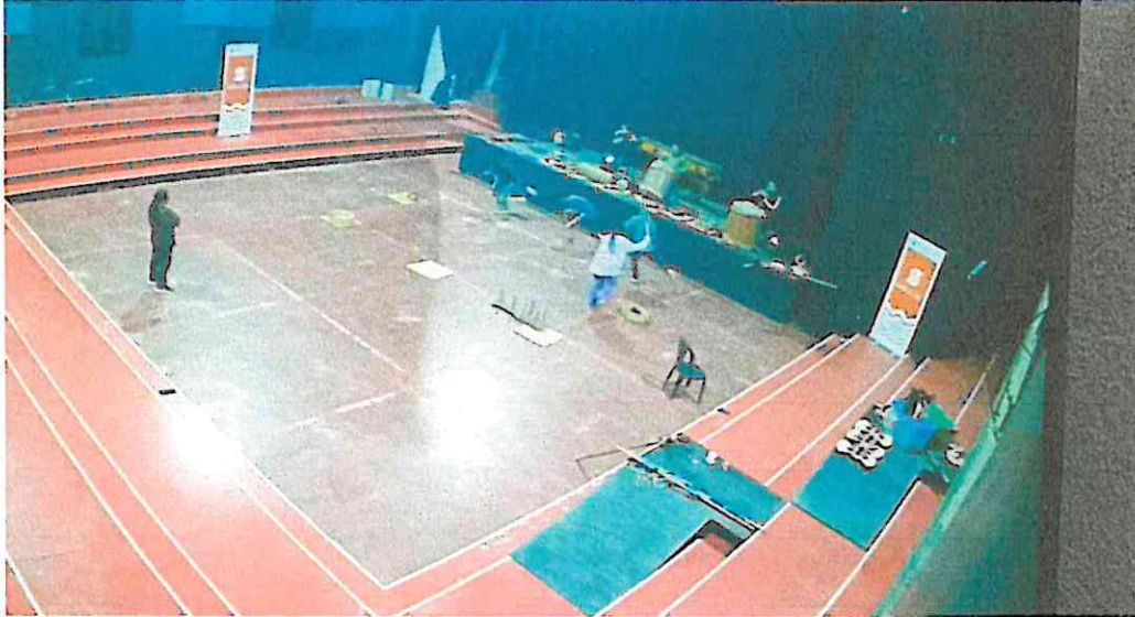
Ensayos de la danza: Wojay – Vivencias en el Hogar Sede del Grupo Sotz'il 19/07/2024