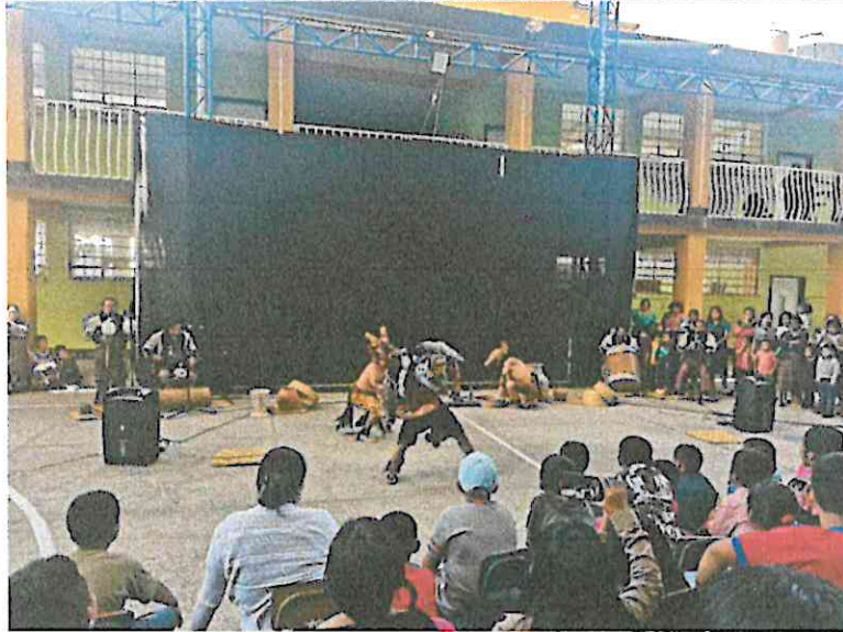
Escena de la presentación de danza: Wojay – Vivencias en el Hogar, Grupo Sotz'il, E.O.U.M Jornada Matutina San Pablo La Laguna, Sololá 24/07/2024