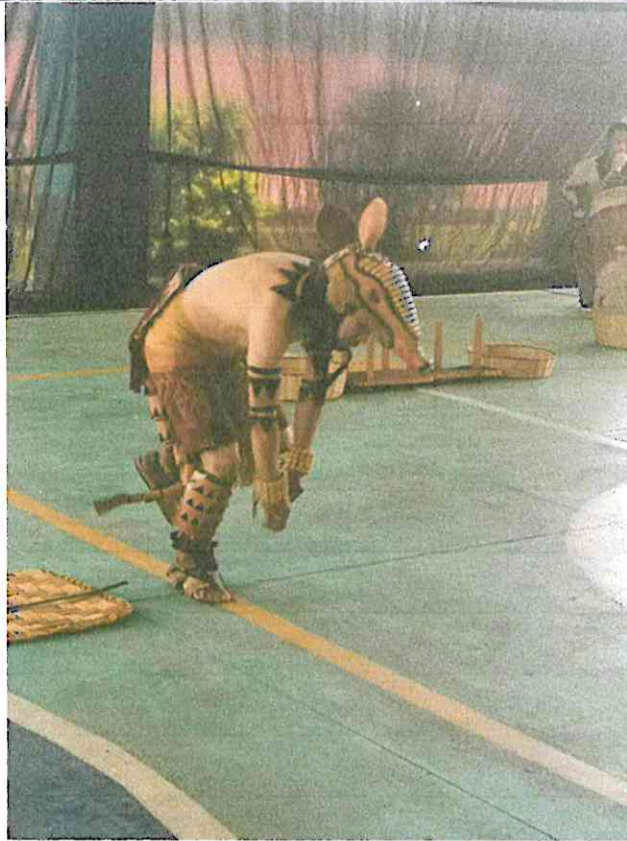
Escena de la presentación de danza: Wojay – Vivencias en el Hogar, Grupo Sotz'il E.O.R.M Comunidad de Chuk Muk, Santiago Atitlan, Sololá, Guatemala. 23/07/2024