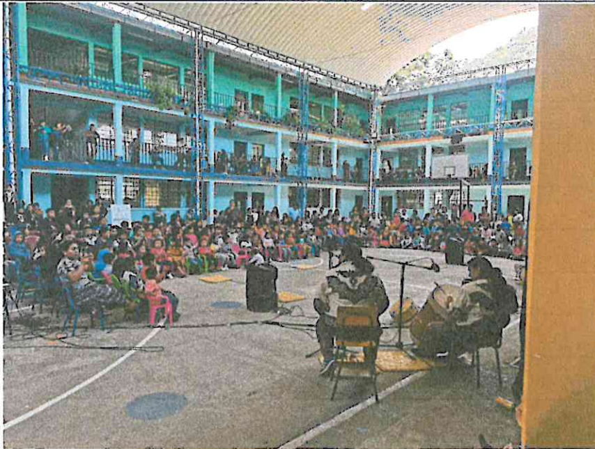
Escena de la presentación de danza: Wójay – Vivencias en el Hogar, Grupo Sotz'íl, E.O.U.M Jornada Matutina San Pablo La Laguna, Sololá 24/07/2024