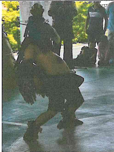
Escena de la presentación de danza: Wójay – Vivencias en el Hogar, Grupo Sotz'il E.O.R.M Comunidad de Chuk Muk, Santiago Atitlan, Sololá, Guatemala. 23/07/2024