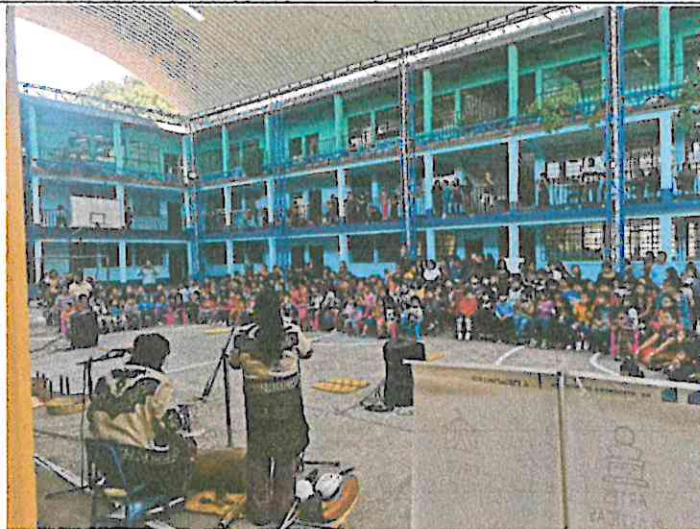
Publico en la presentación de danza: Wojay – Vivencias en el Hogar, Grupo Sotz'il, E.O.U.M Jornada Matutina San Pablo La Laguna, Sololá 24/07/2024