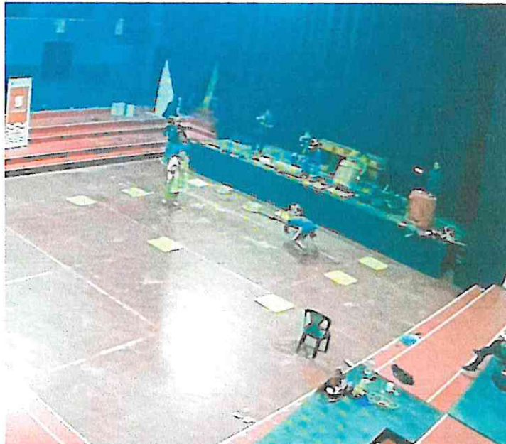
Ensayos de la danza: Wojay – Vivencias en el Hogar Sede del Grupo Sotz'il 22/07/2024